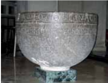
St. Domènec, Peralada, pica baptismal del segle XI-XII