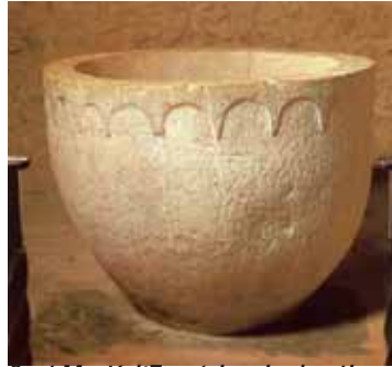
Sant Martí d'Empúries pica baptismal del S. XII-XIII

de rentar, es a dir, s'introduïa un home brut (pecador) i el treien net (sense pecat). Per fer expressiu aquest acte del bateig, entrava a la pica o banyera mirant a tramuntana (nord), sinònim de mort i pecat, i sortia en direcció