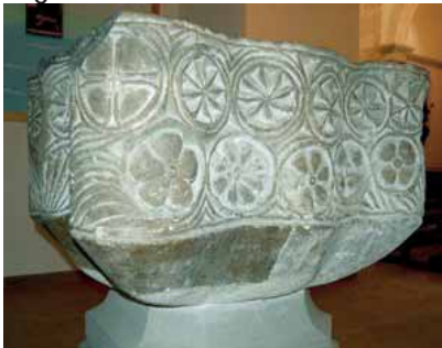
St. Jaume dels Domenys pica baptismal

El seu significat és polisèmic, tot i que principalment se l'ha considerat un símbol solar relacionat amb l'heliolatria o adoració al Sol. Per aquest motiu es pot entendre també com un element de significació celestial o astral, vinculat amb la vida, la regeneració, la immortalitat i l'eternitat. La sexafòlia admet una interpretació de