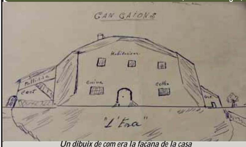
Un dibuix de com era la façana de la casa