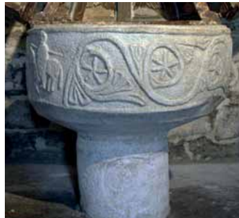
Gausac St. Martí (Vall d'Aran) (amb la flor de la vida)

caràcter numerològic a partir dels tres nombres que posa en relació: 1 (cercle), 6 (pètals) i 12 (arcs), que la vincularien amb el simbolisme zodiacal, la roda còsmica i l'any solar.