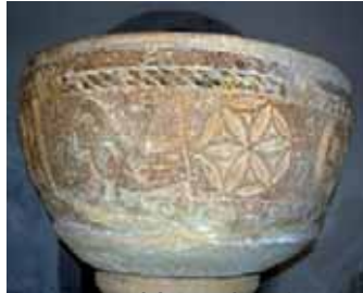
St. Llorenç del Penedès, pica amb sexafolia (flor de la vida)