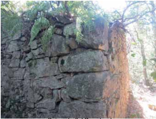
Ruïnes de Cal Desentegat