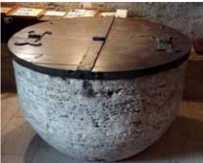
Pica baptismal de Sta. Maria de Porqueres.