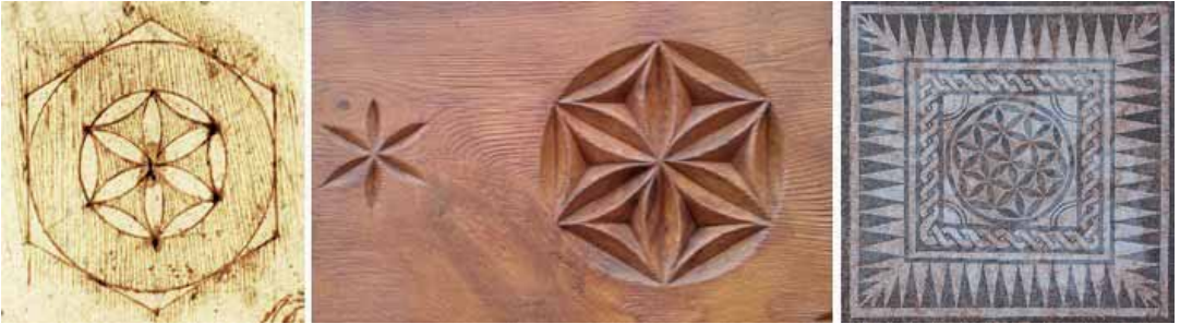
Figura en l'ornamentació de nombroses ermites romàniques pirinenques, per exemple a les portalades de Sant Joan d'Isil, Sant Llorenç d'Isavarre, Sant Lliser d'Alós i Sant Martí de Borén (Alt Àneu) o a la volta del comunidor de Santa Eulàlia d'Encamp (Andorra), però també es pot trobar en zones més allunyades de l'alta

creu. El mateix disseny que a Itàlia és conegut com a Flor Hexapétala o Roseta hexapétala . es poden trobar en mosaics romans i altres construccions a manera decorativa. Segles més tard reapareixen amb profusió a esglésies romàniques, edificis importants i tota mena d'articles de pedra i fusta.