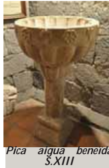
Pica aigua beneïda S.XIII

En l'estudi dels símbols, s'observa que molts cops s'associa la perla que neix d'una petxina amb la figura de Crist i la regeneració i la vida. La pica d'aigua beneïta o beneïda es troba a l'entrada del temple.