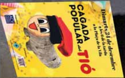
La Núria donant cops de bastó al Tíó