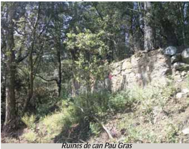
Ruïnes de can Pau Gras

darrere la masia de cal Tallador, hi havia una altra casa, coneguda per la Caseta del Tayadó, i també per Can Pau Gras. No seria estrany, ja que la gent de moltes cases de pagès vingueren al poble quan va començar a créixer.