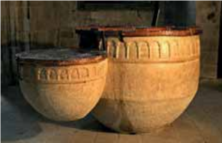
SBasilica de Castelló d'Empúries pica baptismal per immersió, la petita per infants S.XIII.

La petxina neix, també, del concepte de matriu, de portadora de vida i de fertilitat.