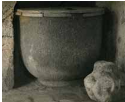
Pica baptismal de Pau, alt Emporda

ja existia a l'atri una font, que els fidels utilitzaven per rentar-se mans i cara abans d'entrar-hi. En els segles XI-XII, ja es fa present una