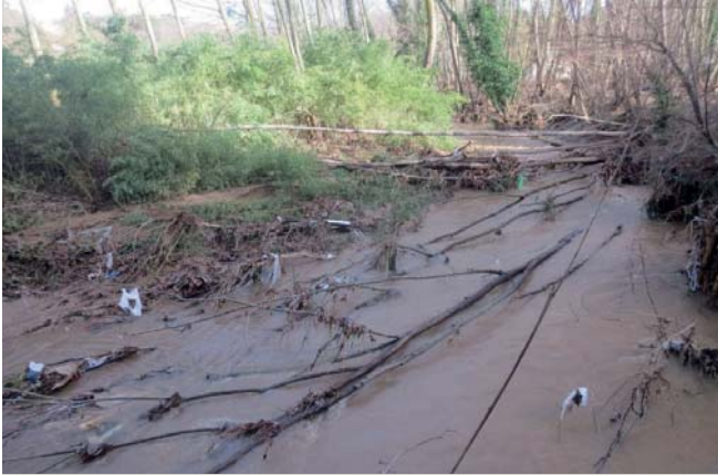
Una foto de la riera en el temporal Glòria plena d'arbres i brutícia

aquest torrent era força ple d'arbres, a més es va taponar el tub del costat de l'escola i l'aigua va passar per on era més fàcil.