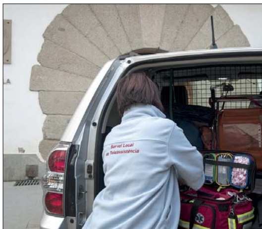
Unitats mòbils del Servei Local de Teleassistència, un servei 24 hores i 365 dies l'any.

mòbils d'informació al consumidor (UMIC) —des del 1996—, i la teleassistència —des del 2005—. D'altres