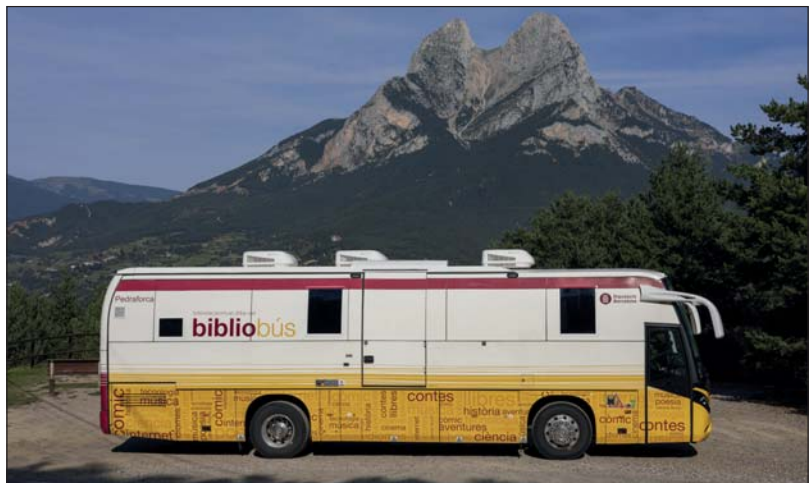
El bibliobús Pedraforca dona servei a les poblacions del Berguedà.