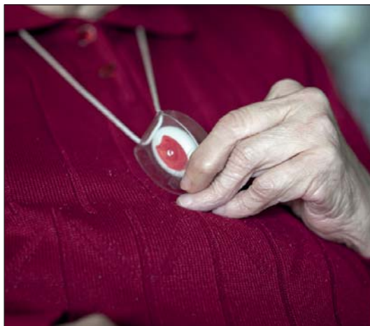
Les persones usuàries del Servei Local de Teleassistència disposen d'un dispositiu per utilitzar en cas d'emergència.

Alguns d'aquests serveis tenen ja una llarga història i són molt coneguts pels habitants de molts pobles i ciutats, com els bibliobusos —en marxa des de fa més de 65 anys—, les unitats