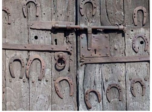
Església de Sant Martí de Campmajor (El Pla de l'Estany)

senyor del castell va anar a buscar menjar i almoina per donar-li, però en obrir la porta, el sant havia desaparegut i li havia deixat l'espasa. L'arma que tenia poders especials, va servir per matar un drac que tenia espantada la contrada.