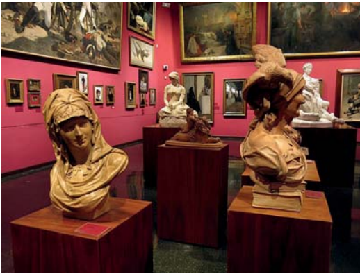
Biblioteca-Museu, Víctor Balaguer, escultures de la pinacoteca