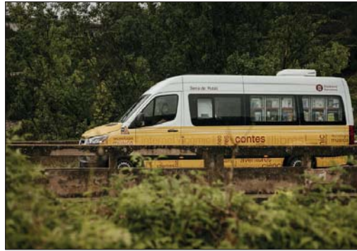
El bibliobús Serra de Rubió és un dels nous vehicles lleugers.

Els bibliobusos treballen en xarxa, integrats dins d'una zona bibliotecària, i compten amb el suport d'una biblioteca central. Ofereixen una gran varietat de serveis i posen a l'abast dels veïns i veïnes dels municipis