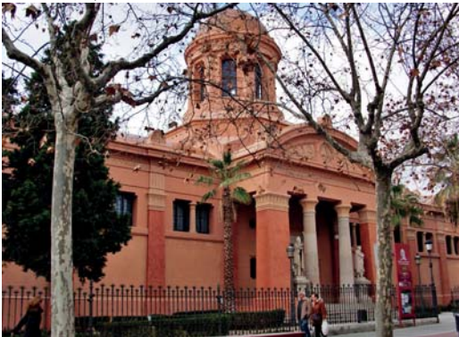
Biblioteca-Museu, Víctor Balaguer (Vilanova i la Geltrú)

i diverses col·leccions procedents de donacions particulars.