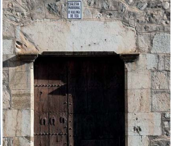
Esglésies de Sant Martí de Castell del Far (Alt Emporà i de Sant Martí de Vilallonga de Ter (El Ripollès)