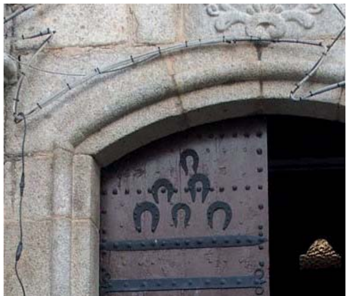
Església de Sant Martí de Viladrau