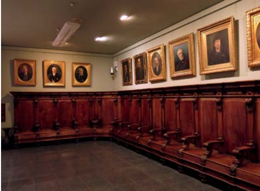
Biblioteca-Museu, Víctor Balaguer (Vilanova i la Geltrú), sala de juntes