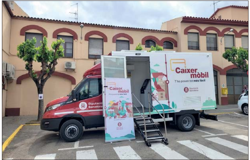
El caixer mòbil arriba als municipis de fins a 5.000 habitants que no disposen de serveis bancaris.

En aquests moments el servei està en procés de digitalització amb l'objectiu d'avançar cap una teleassistència que sigui capaç de predir necessitats i situacions de risc. També s'està fent la instal·lació gratuïta de sensors en habitatges de persones grans usuàries del servei, que ajudin a detectar canvis en els seus hàbits com a conseqüència del seu deteriorament cognitiu o de problemes de salut.