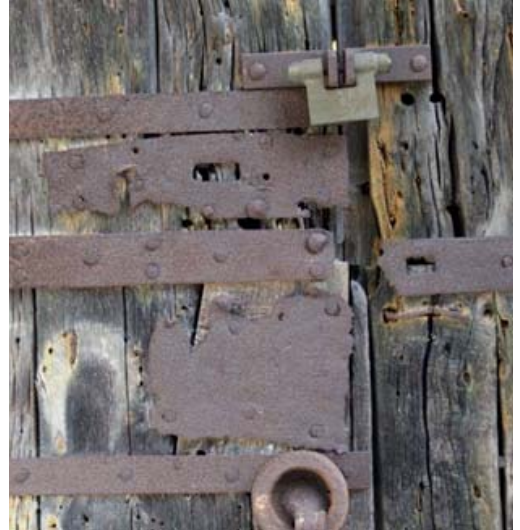
Església de Sant Martí de la Mota (El Pla de l'Estany) Ha quedat la marca, les han robat no fa gaire.