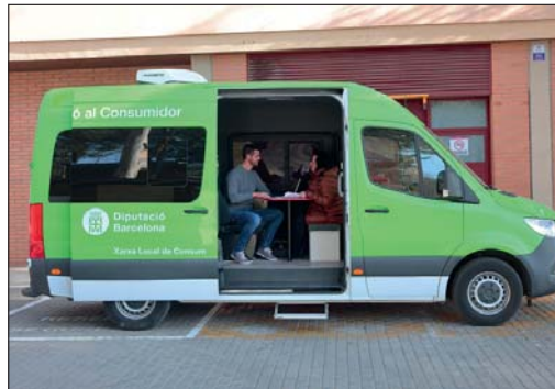
Les UMIC ofereixen a la ciutadania informació sobre drets en matèria de consum. DIPUTACIÓ DE BARCELONA

documents de tota mena: llibres, audiovisuals, revistes, diaris, etc. Permeten l'accés al catàleg Aladí de la Xarxa de Biblioteques Municipals, amb prop de 900.000 títols diferents i més d'11 milions de documents, que es poden sol·licitar, si cal, a través del préstec interbibliotecari. A més, tenen un paper molt actiu en la dinamització cultural del territori, amb la programació d'activitats per fomentar la lectura entre el públic infantil i l'adult.