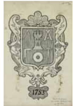
Picapedrers treballant a pedrera de granit lloc el Pirineu. Escut del gremi de picapedrers molers, arquitectes i mestres de cases de Barcelona