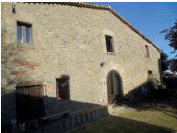
Masia de Can Plana del Iuro