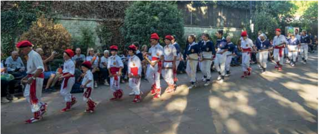
Presentació del integrants de la colla de bastoners de Vallgorguina que van ballar per la Festa Major Major la ballada bastonera.

Gràcies a aquestes famílies vallgorguinenques, que han estimat tant la cultura del poble i el ball de bastons principalment, som aquí i aquest any amb els ànims ben amunt.