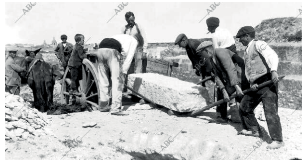
Diversos moments de tallar la pedra i transport de la mateixa. Veiem com les movien amb parpalines.