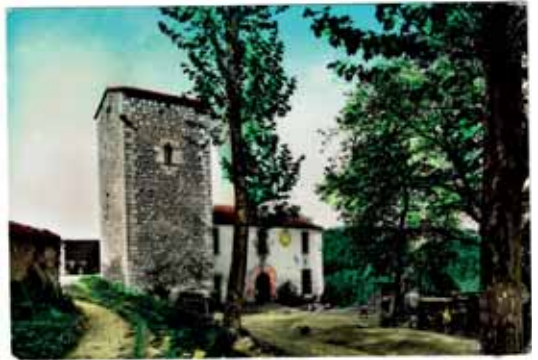
Masia de Can Vilar